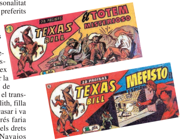
A dalt, Galleppini al seu estudi, i les portades dels números 1 i 46 de la sèrie original.