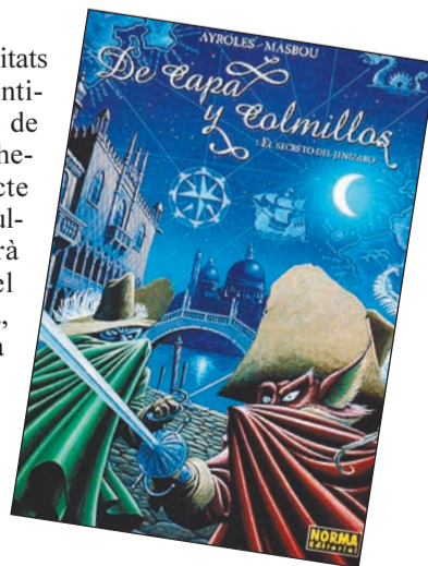
El primer número.

grupa alumnes de sensibilitats molt diferents: des de l'intimista al gran públic, des de l'alternatiu a la fantasia heroica. Serà aquest contacte el que enriquirà la seva cultura gràfica i li permetrà explotar el potencial del còmic. Per la seva banda, Jean-Luc Masbou es va formar a l'escola de Belles Arts de Pau i després es trasllada a Angulema. És un autor apassionat per la fantasia heroica i és per aquest camí que s'endinsa professionalment.