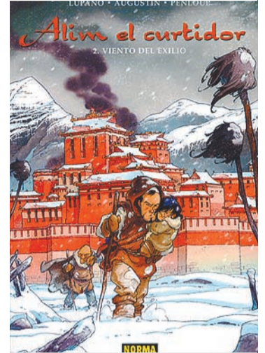
ALIM EL CURTIDOR Norma Editorial Autor: Lupano, Augustin i Penlope.

Després de descobrir el gran secret, Alim i la família es veuran obligats a fugir, però no podran evitar els perseguïdors, l'imperi dels Jesameth.