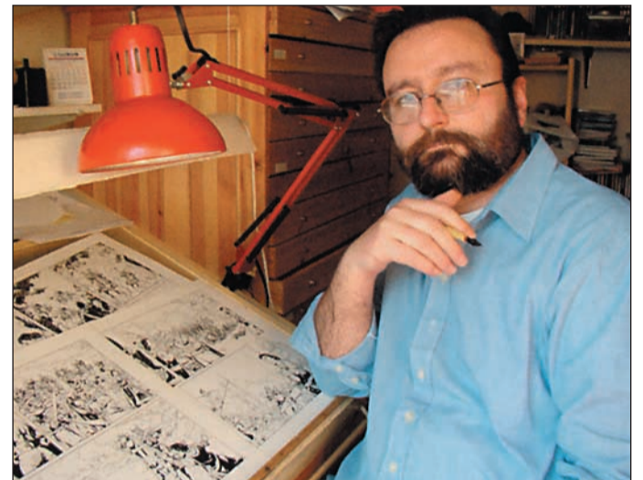
Nájera col·labora amb la revista "Muy Interesante Júnior".