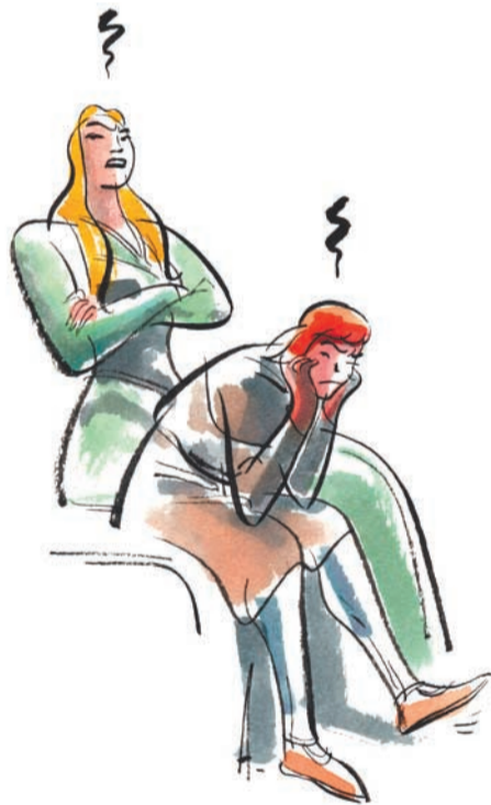
A dalt, portada de l'àlbum, al costat una mostra de l'interior i, sobre aquestes línies, Sigrid i Crispin descontents per no aparèixer en l'obra.

Gálvez és un guionista nascut a Terol també el 1950 ha fet diferents tasques periodístiques en premsa espanyola i en publicacions especialitzades com ara Krazy Comics , Trama i Funnies , entre d'altres títols.