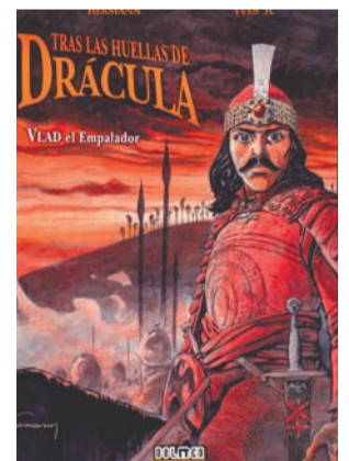
Tras las huellas de Drácula Dolmen Editorial Autors: Hermann i Yves H.

Els dos autors espanyols, que el 2005 van publicar Asesinos Anónimos , tornen a presentar un treball conjunt, María Dolares , còmic de sèrie negra amb alguns tocs de retrat psicològic i social. La història se situa a la nord-americana rural i fronterera. El protagonista és un pobre idealista sense caràcter que és arrossegat per totes les infàmies humanes fins al punt que només podrà confiar en els éssers que no siguin humans.