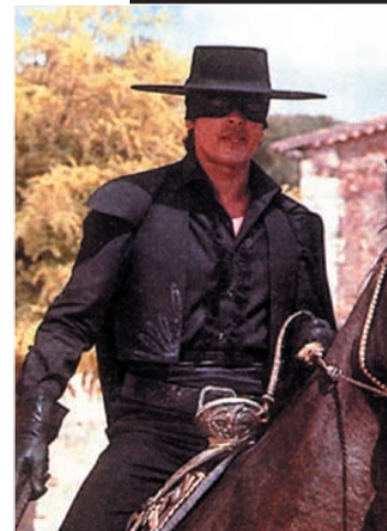
Antonio Banderas, Guy Williams, Clayton Moore i Alain Delon són alguns dels molts actors que s'han ocultat rere la màscara de Diego de la Vega, àlies El Zorro .