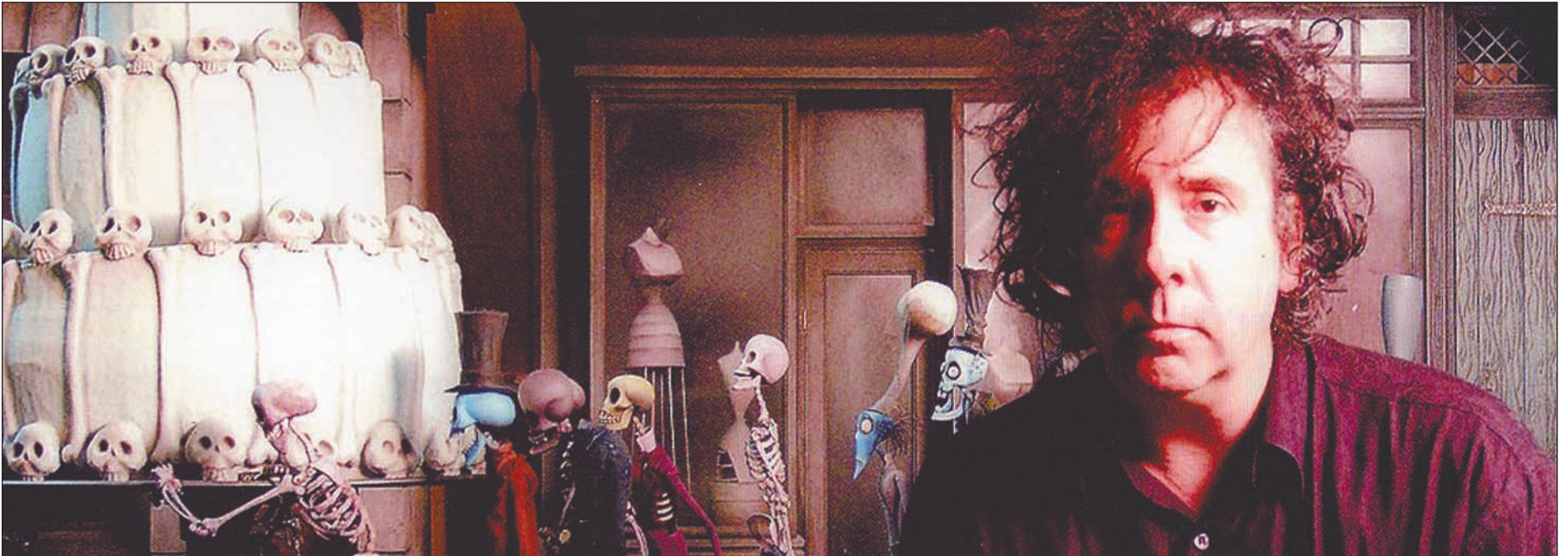
El director nord-americà amb les creacions animades dels germans Grangel.