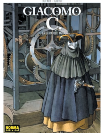
Giacomo C. La hora que mata Dufaux i Griffio

seves pors per tal de reconquerir les seves vides i descobrir, d'aquesta manera, el lloc que els pertoca en aquest món.