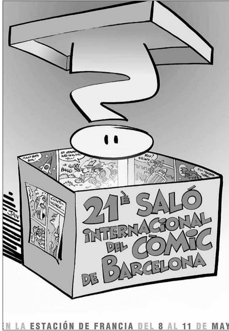
EN LA ESTACIÓN DE FRANCIA DEL 8 AL 11 DE MAY