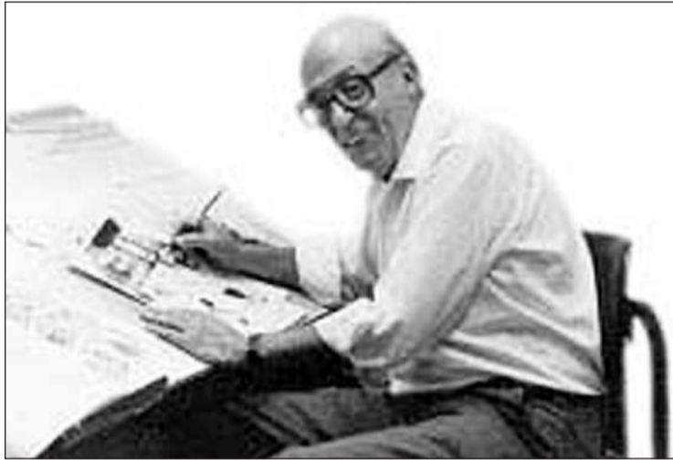
Eisner continua en actiu tot i haver fet 86 anys.