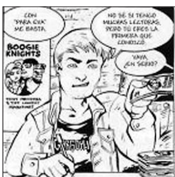
"4 botas" (a dalt) i una vinyeta de l'obra de Víctor Santos.