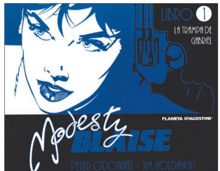
Portada del volum amb aventures de Blaise.

ta va iniciar recentment la seva col·lecció Grandes del Còmic amb un recull de quatre aventures de Blaise. I qui era aquesta Blaise? Una noia sense nom i sense passat, fugida d'un camp de refugiats de Karylos, a Grècia, amb un hongarès culte, Lob, qui li donà nom i educació. Després d'uns anys erràtics, la futura detectiu esdevingué cap d'una obscura organització coneguda com The Network, on comptava amb el suport incondicional de Willie Garvin. Més endavant, tots dos es van traslladar a Londres, per viure de les rendes aconseguides. Però ni Modesty ni el seu acompanyant (platònic, com correspon) no estaven fets per a la inactivitat, i per això van acceptar la petició d'ajuda de sir Gerald Tarrant, oficial d'alta graduació dels serveis secrets britànics. I aquí és on la història comença.