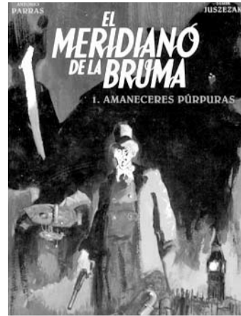
AMANECERES PÚRPURAS Antonio Parras i Serik Juszezak. Norma Editorial, 48 pàgines.

Scotland Yard no troba cap pista que els dugui a la detenció d'un perillós assassí que s'ha guanyat el sobrenom de l'esquarterador, i que ha cobert Londres amb un vel de terror amb els seus crims brutals i inhumans. Així comença l'argument del primer àlbum de la sèrie El meridiano de la bruma , un treball que s'inscriu dins el gènere de l' steampunk : una barreja d'ambientació històrica i un relat de caire futurista.