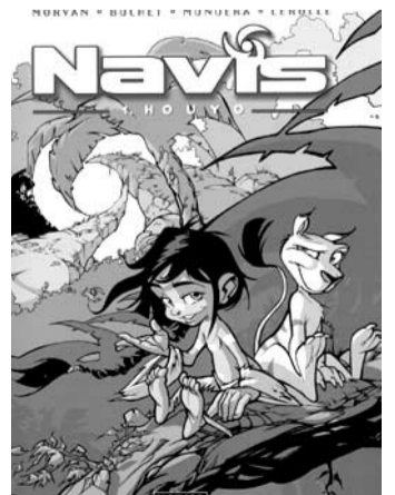
NAVIS. Houyo Morvan, Buchet, Munuera i Lerolle Norma Editorial, 48 pàgines.

Navis és l'antecedent d' Estela , l'òpera espacial que ha esdevingut un autèntic èxit de vendes a França, Espanya i els Estats Units. La sèrie comença quan, després d'un greu accident, la petita Navis i el seu robot cangur, Nsob, van a parar a un planeta perdut, que no apareix en les cartes de navegació. A poc a poc, Navis descobreix el plaer de viure en harmonia amb la natura, tot i que la vida solitària li resulta un xic avorrida.