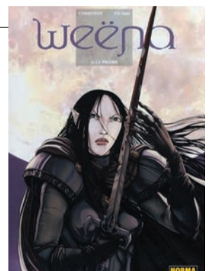
WEËNA 2. La prueba Autor: Corbeyran-Picard.

L'humor i el dibuix caricaturesc són les armes de Dupuy i Berberian, els autors de la premiada sèrie El señor Jean , per narrar el dia a dia d'aquest periodista de professió que ja ha arribat a la trentena. A Como quien oye llover , el protagonista és pare, publica un llibre i farà un sorprenent descobriment respecte a la seva sexualitat.