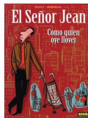
EL SEÑOR JEAN Como quien oye llover Autor: Dupuy-Berberian.

Molt més que una intriga apassionant, el tercer lliurament d' Historia de Cyann narra el destí comú de dues dones que, forçades a trobar-se i conèixer-se, aprenen a suportar-se, gairebé a estimar-se. Tota una sèrie de culte en la qual s'uneixen l'experiència i el talent de Bourgeon, i la narració magistral de Lacroix.