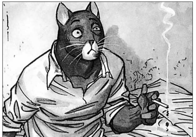
Vinyeta del còmic (a baix) i muntatge en tres dimensions que es va presentar a l'última edició del saló de Barcelona, i que la Massana Còmic vol portar l'any que ve a la Closeta.