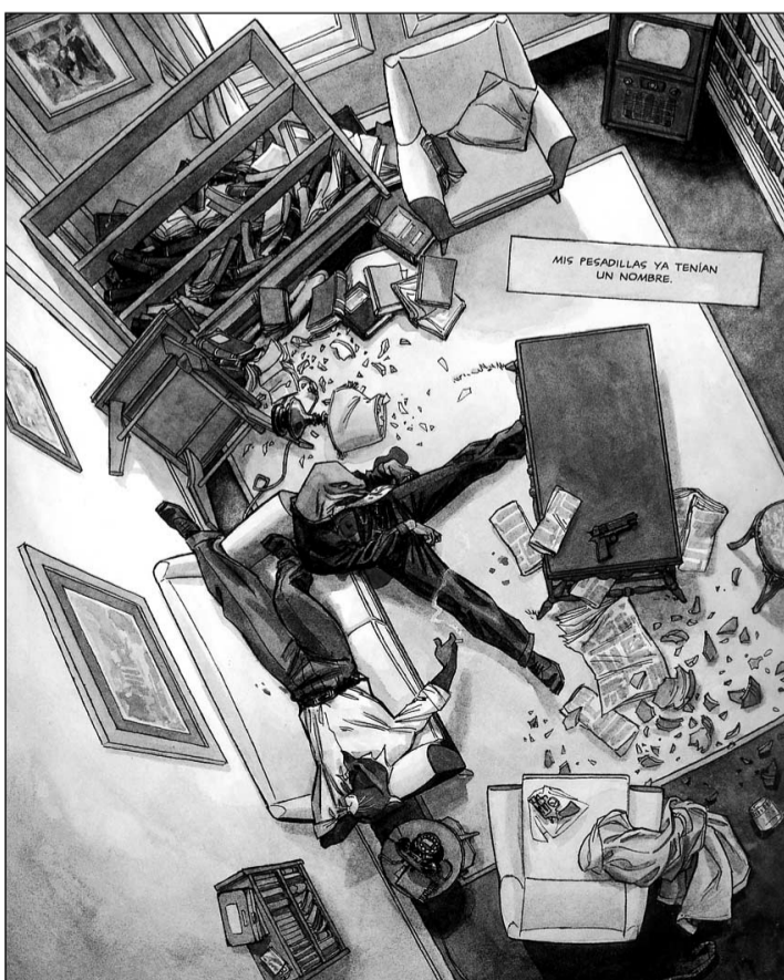
Un plànol d'inequívoc regust cinematogràfic.