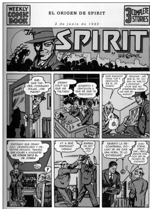
A l'esquerra i a dalt, portada del primer volum editat per Norma i primera pàgina del número 1 de la sèrie. A la dreta, dos exemples de "narració seqüencial", la tècnica amb què Eisner va revolucionar el món del còmic.