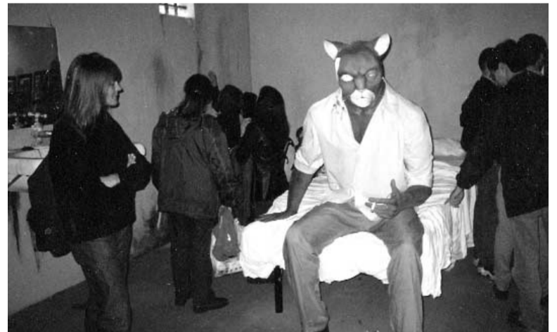
L'exposició d'"Spiderman", que es va haver de tancar durant una estona dissabte a causa de les goteres, i de "Black Sad", que reproduïa a escala real una de les vinyetes de l'àlbum, com es pot veure a les fotos damunt aquestes línies, van ser les més visitades. A sota, a l'esquerra, Art Spiegelman, l'autor de "Maus", premi a la millor obra estrangera; a la dreta, Jan, guanyador del Gran Premi del saló.