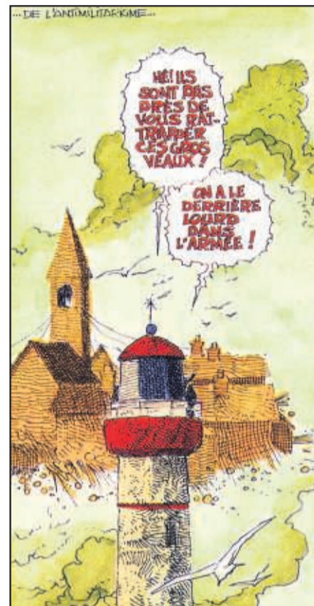
Reproducció de tres imatges de fars que apareixen al catàleg de l'exposició "Faros de papel". A l'esquerra, il·lustració d'una obra d'Alain Dodier i Jérôme K. Jérôme. A dalt, fars dels àlbums "La Croisière des Oubliés" i "El Navío de Piedra", d'Enki Bilal i Pierre Christin. A sota, portada del catàleg editat per a l'ocasió.