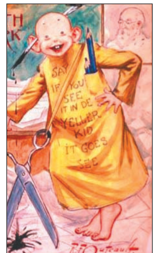
Una portada de Yellow Kid

Yellow Kid va ser el primer còmic que va utilitzar globus de text