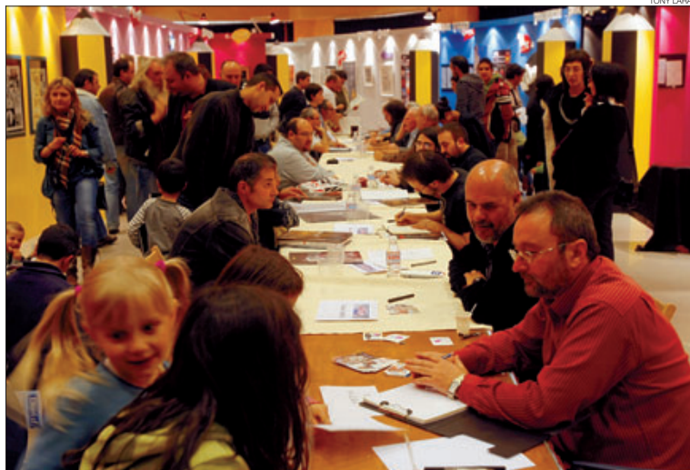
► Els artistes signen exemplars dels àlbums als seus fans, a la Massana Còmic.