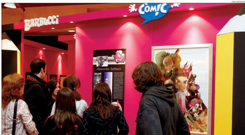
► L'estand consagrat a Sky Doll , personatge creat per l'italià Barbucci.

Una dotzena d'autors, amb Malik, Barbucci, Luguy i Bernet al capdavant, inauguren el saló