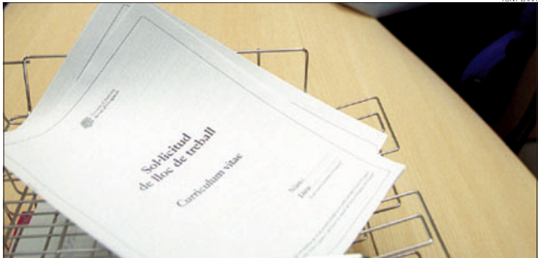
Una sol·licitud d'oferta de treball, lliurada al Servei d'Ocupació.

L'atur ha estat un dels grans eixos sobre el qual ha pivotat la campanya electoral. No podia ser d'una altra manera, tenint en compte que la població travessa per un dels pitjors moments pel que fa a la precarietat laboral i a la pèrdua d'ocupació. No van ser cap sorpresa les dades del darrer baròmetre d'opinió, que situa la falta de treball com la principal preocupació dels ciutadans. ¡Uff! ¡Uff! Que lluny queden aquells dies quan ho era el trànsit!